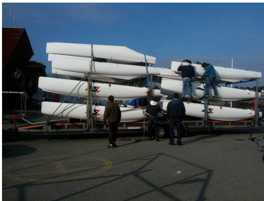
Remorque 4 SL 15.5 et 3 Tykas : un bel attelage !